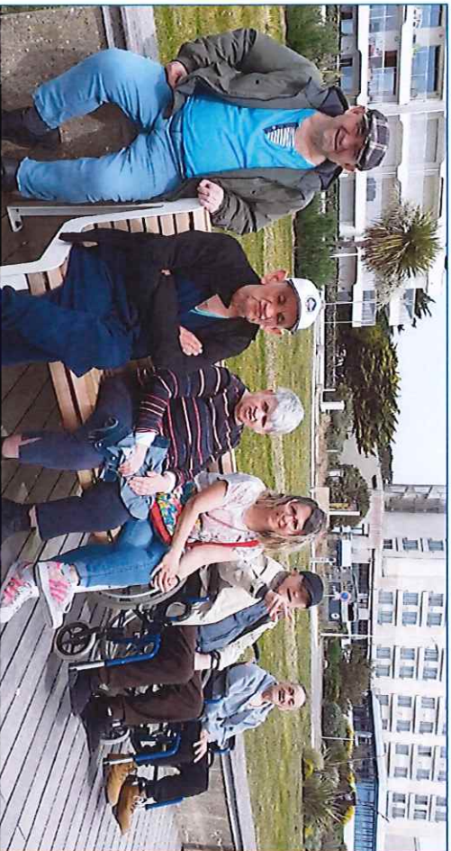
Balade à l'Océan avec Les Camélias.