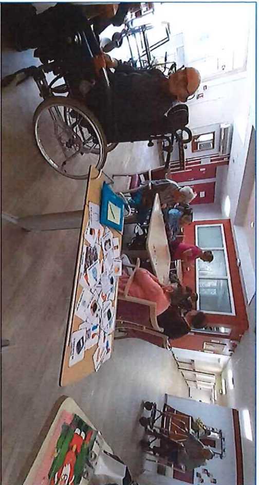
Le loto est toujours attendu et apprécié aux Camélias.