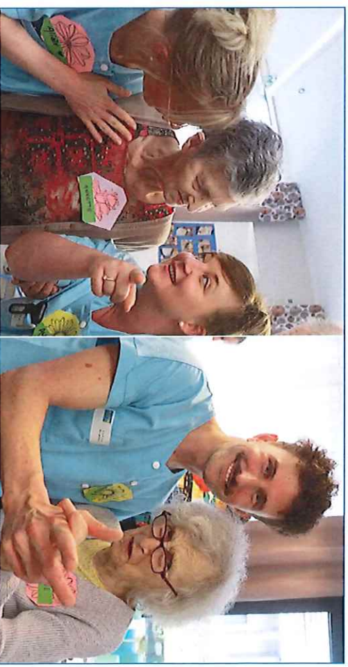
C'est la fête à la petite maison pour notre bal de printemps