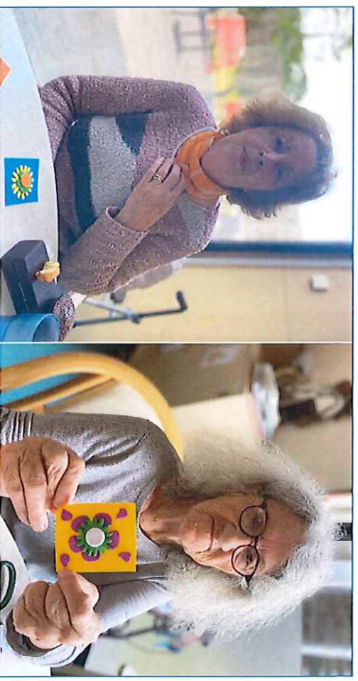
Confection de fleurs afin de décorer la salle à manger