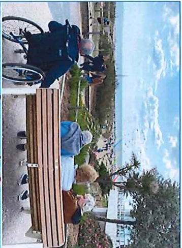
balade au festival du vent. Le vent était bien au rendez vous !