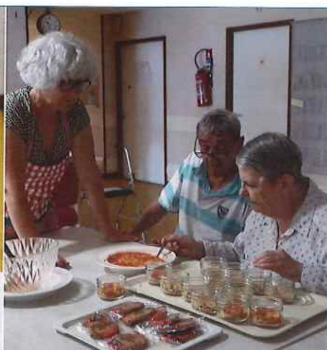
les pâtisseries sont très appliqués