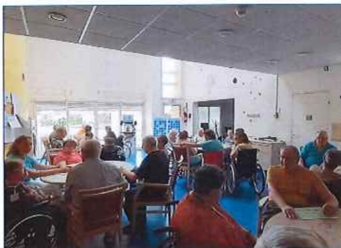
On se concentre à Fleur d'Ajonc pour le loto !