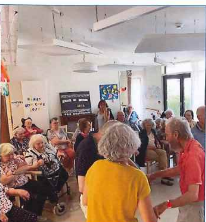
Fête de la musique avec DAFFY sur les Sylphes